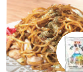
「マルモ食品」(静岡県) 富士宮やきそば (2人前) 692円