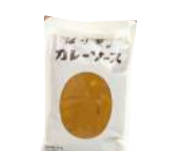
「はり重」(大阪府・道頓堀) カレーソース (2人前) 864円 ※4/6入荷なし