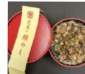
「丸萬本家」(大阪府・住吉区) 鯛めし (1折) 1,296円