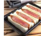
「グリル梵」(大阪府・新世界) ビーフ ヘレカツサンド (4切入) 1,101円