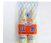
「大屋食品」(長崎県) 佐世保豆乳 各種 (180ml×2) 281円