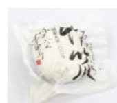
「丹沢大山 五右衛門」(東京都) 石臼竹炭とうふ (500g) 646円