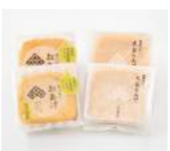
「谷口屋」(福井県) ・おあげ (1枚) 648円 ・太白おあげ (1枚) 702円