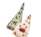
「御菓子司 絹笠」(大阪府・鶴見区) とん蝶 (1個) 378円