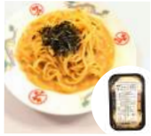
「中華のサカイ」(京都府) サカイの冷麺 麺・タレのセット (2人前) 1,200円