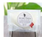
「丹後ジャージー牧場 ミルク工房そら」(京都府) ナチュラルチーズ モツアレラ (100g) 751円