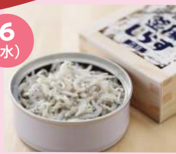
「山梨缶詰」(静岡県) 静岡 釜揚げしらす缶詰 (40g) 432円

日本一深く豊かな海、駿河湾で獲れるしらすは静岡の名産品。余計なものを入れず、美味しいしらすの味をそのまま閉じ込めました。おつまみやおかずの一品としてお楽しみください。