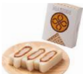
「とんかつ まい泉」(東京都) ヒレかつサンド3切れ (1箱) 422円