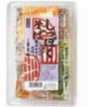
「富美家」(京都府) しっぽくそば (510g) 465円