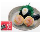
「天むす・すえひろ」(大阪府・城東区) 天むすエビ (5個入) 773円