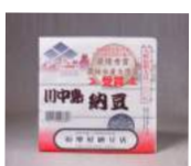
「増屋納豆店」(長野県) 川中島納豆 (90g) 222円