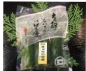
「京つけもの 新町三宅」(京都府) きゅうり生姜 (4本入) 540円