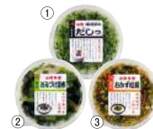
「尾花沢食品」(山形県) ①だしっ(220g) 432円 ②おみ漬け昆布(220g) 432円 ③おかず松前(200g) 432円