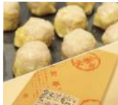
「一芳亭本店」(大阪府・難波) しゅうまい (15個入) 1,051円