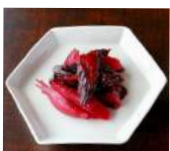
「ニシダヤ」(京都府) ・おらがむら漬 (100g) 508円 ・胡瓜しば漬 (100g) 562円