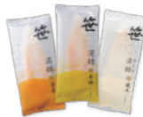
「高政」(宮城県) 笹かまぼこ ・吉次(1枚) 206円 ・石持(1枚) 184円 ・蔵王(1枚) 184円