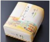
「道頓堀 今井」(大阪府・道頓堀) お手軽きつね うどん (1人前) 810円