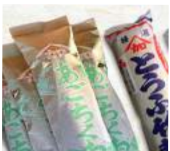
「からや商店」(鳥取県) ・あごちくわ (130g) 584円 ・とうふ竹輪 (110g) 130円