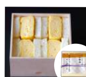
「京料理 松正」(京都府) 料亭のだし巻き 玉子サンドイッチ (4個入) 756円

※写真は全てイメージです。 ※表示価格は、消費税を含んだ税込価格です。 ※数に限りがございますので売り切れの際はご容赦くださいませ。